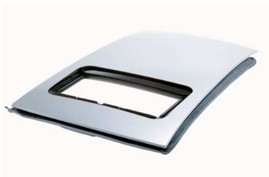
Schiebedach Arvin Meritor

Die Verwendung von μ-MUSYCS garantiert nicht nur die Durchführbarkeit der Messungen, sondern auch einen hohen Grad an Automatisierung. Über die Netzwerkverbindung werden die Zyklen direkt vom Server auf das Messsystem überspielt.